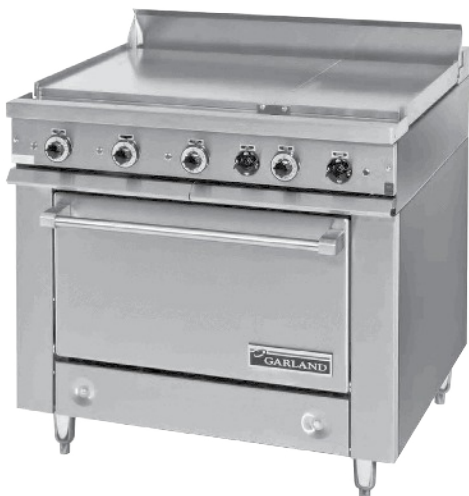
Plancha industrial a gas G36R-0072 marca Garland