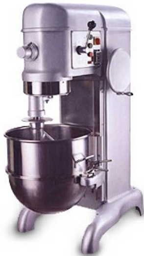
Batidora industrial de 60 litros marca IBoia

Las batidoras industriales IBOIA son equipos de alta calidad. Con mas de 10 años en el mercado dan respaldo de la confiabilidad de este producto. La batidora industrial serie BM es capaz de amasar, batir y sobar todo tipo de harinas, mezclas ligeras, masa para tortas, cremas pasteleras, etc. La caja de transmisión por correa, tres y cuatro velocidades, motor de alta durabilidad, controles de fácil accesibilidad, base inferior abierta, pintura gris metálica de alta resistencia y accesorios de fácil extracción.