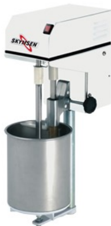
Batidor para helados BAK-16 y BAK-30 marca Skymesen

Máquina para hacer helado Skymesen. Posee un exclusivo sistema en la parte superior que aumenta el rendimiento y la producción de helados; lo que se traduce en mayor volumen de helados en un menor tiempo. En sus dos versiones de 16 y 30 litros de capacidad, la máquina para hacer helado tiene un batidor tipo rabo de cochino para mayor producción. Pintura blanca de alta resistencia aplicada de forma electrostática. Producción 30kg/hr y 50kg/hr. respectivamente. Nota: la tolva de la barquillera no es refrigerada