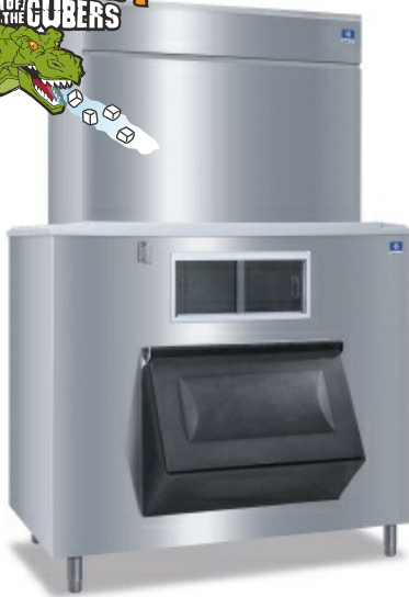
Quadzilla Series S3300 Contenedor B-1400

Diseñado para operarios que saben que la producción de hielo es crítica para su negocio, la nueva serie Indigo™ incluye un controlador con diagnóstico preventivo el cual continuamente monitorea la producción de hielo por sí misma. Desarrollos en innovación en saneamiento y programación hacen de esta máquina la más fácil y menos costosa para operar.